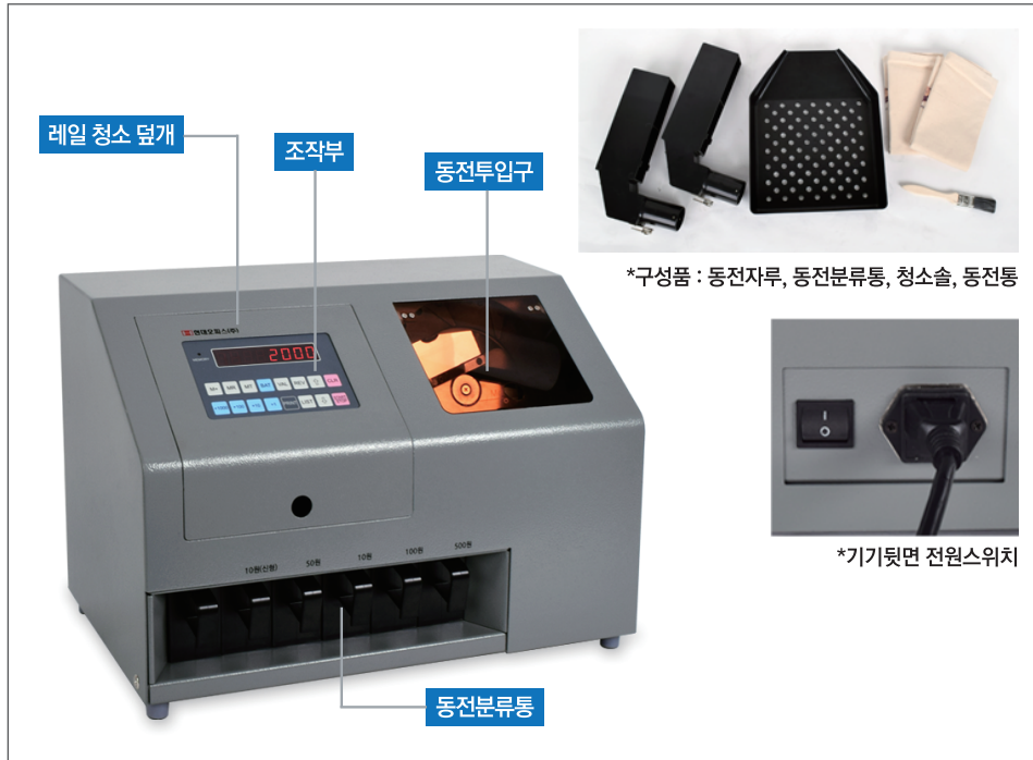
*구성품 : 동전자루, 동전분류통, 청소솔, 동전통