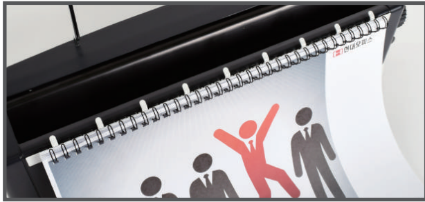
4. 링 거치대에 링을 걸고 천공된 종이를 걸어줍니다.