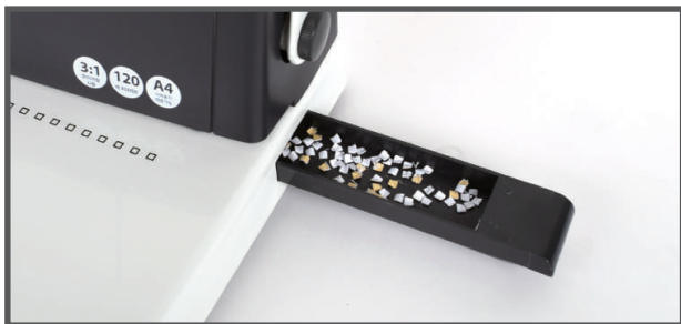
7. 제본이 끝나면 기기우측의 파지함을 비워주세요.