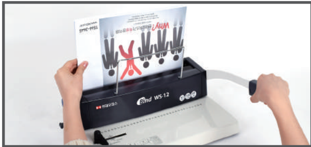
6. 와이어 압착함에 링을 끼운 원고를 아래로 향하게 넣고 핸들을 내려 와이어를 압착하면 제본이 완성됩니다.