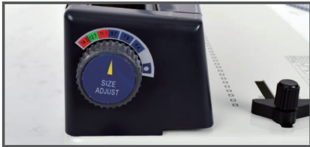
5. 제본할 링 사이즈에 맞춰 링규격 조절레버를 조절합니다.